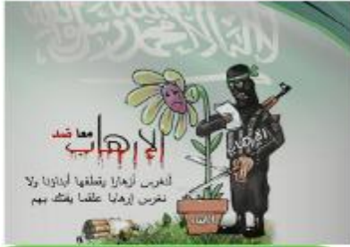
المركز السابع : رميساء محمد 200 ريال