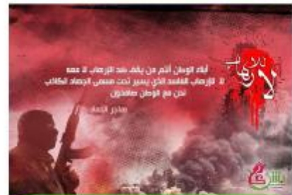
المركز الرابع : هاجر الحماد 400 ريال