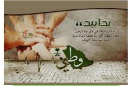
المركز الخامس : فضيلة آدم عيسى 200 ريال