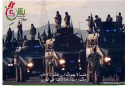
المركز السادس : أرجوان فهد 200 ريال