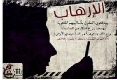
المركز الثاني : غدير آل زعير 800 ريال