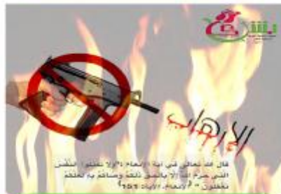
المركز الثامن : شوق الدوسري 200 ريال